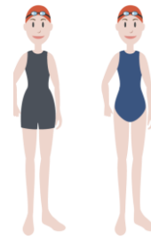
Figura 2 - Exemplificação sobre os fatos permitidos para os nadadores cadetes e infantis femininos.